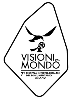
IMMAGINE CURATA DA UN TEAM CREATIVO INTERNO