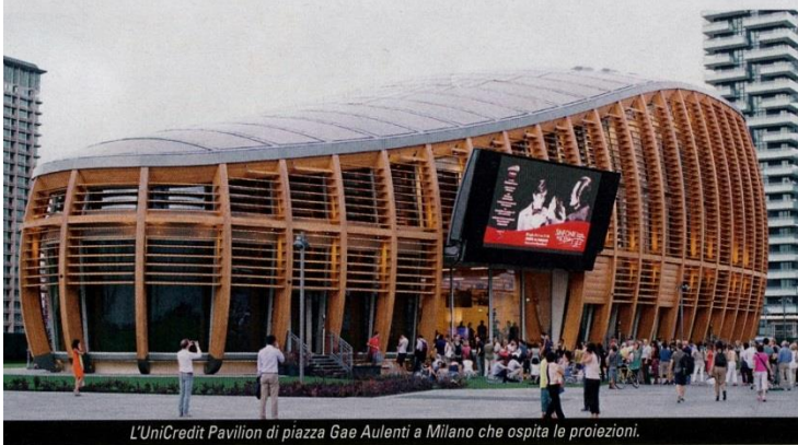
L'UniCredit Pavilion di piazza Gae Aulenti a Milano che ospita le proiezioni.

che, quanto più ci si avvicina alla ricerca delle origini della vita e dell'universo, ci si muova proprio come gli artisti contemporanei guidati da un sesto senso, quello legato all'immaginazione, alla bellezza appunto. Ma tra le molte visioni dal mondo, nella sezione Panorama Internazionale, se ne possono segnalare almeno altre due per dare un senso della varietà dei temi affrontati. Forte fin dal titolo, Brexitannia del regista Timothy George Kelly che racconta dietro le quinte e lo scenario del referendum Leave or Remain per la Gran Bretagna e l'Europa intera. Una storia ai limiti del paradosso quella di Taste of Cement , diretto da Ziad Kalthoum, vincitore del prestigioso Premio Sesterzio d'Oro di Visioni du Réel di Nyon: è il racconto di alcuni rifugiati siriani in Libano che, avendo perso le proprie case, si trovano a costruire i nuovi grattacieli di Beirut. visionidalmondo.it