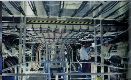
Fabiola Gianotti, direttrice del Cern, e tre immagini del documentario Il senso della bellezza .

DAL 5 ALL'8 OTTOBRE SI APRE A MILANO LA TERZA EDIZIONE DEL FESTIVAL INTERNAZIONALE DEL DOCUMENTARIO, KERMESSE PROMOSSA DA UNICREDIT PAVILION E FRANKIESHOWBIZ