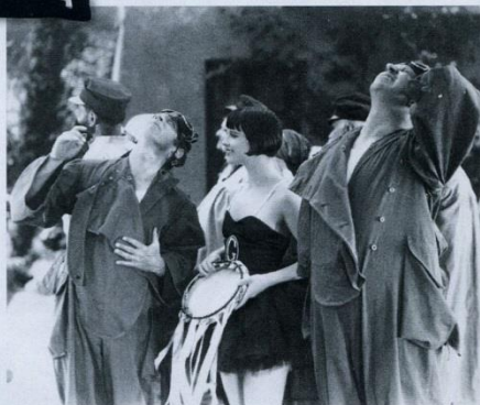
↑ Louise Brooks (1906-1985) nell'inedito Now We're in the Air .